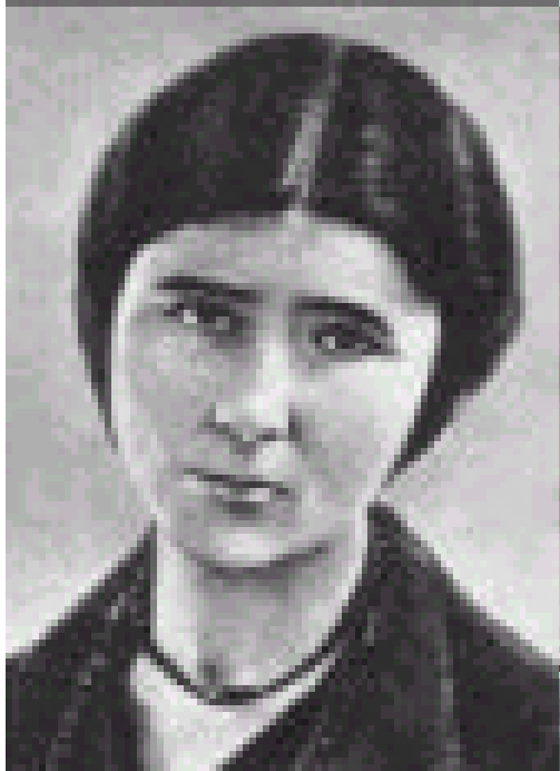
Florbela de Alma da Conceição Espanca